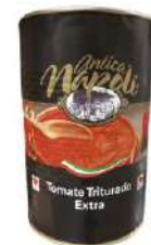
0427071802 Tomate Triturado "Antica Napoli" 4Kg *3