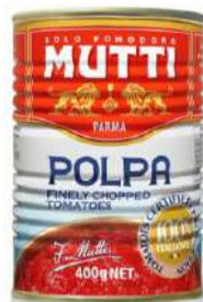
M-POLP-PROV Polpa de tomate "Mutti" 4,1 KG *3