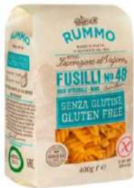
R-FUSG-PROV Fusilli sin gluten "Rummo" N°48 400 Gr