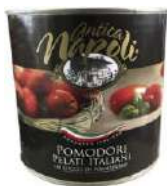
0614000026 Tomate Pelado "Antica Napoli" 2,5Kg *6