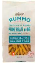
R-PESG-PROV Penne sin gluten "Rummo" N°66 400 Gr