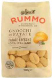
R-GNOC-PROV Gnocchi de patata "Rummo" 500 Gr