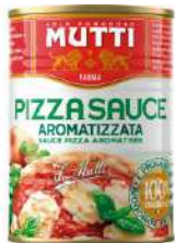
M-SPAR-PROV Salsa pizza aromatizada "Mutti" 4,1 KG *3