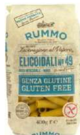
R-ELSG-PROV Elicoidali sin gluten "Rummo" N°49 400 Gr