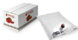
0614000027 Bag in Box "Antica Napoli" 5Kg *2