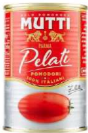
M-PELA-PROV Tomate Pelado "Mutti" 2,5 KG *6